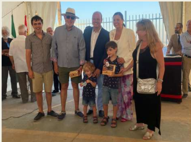
Trofeos para los grumetes los más pequeños participantes en esta VI TRAVESIA