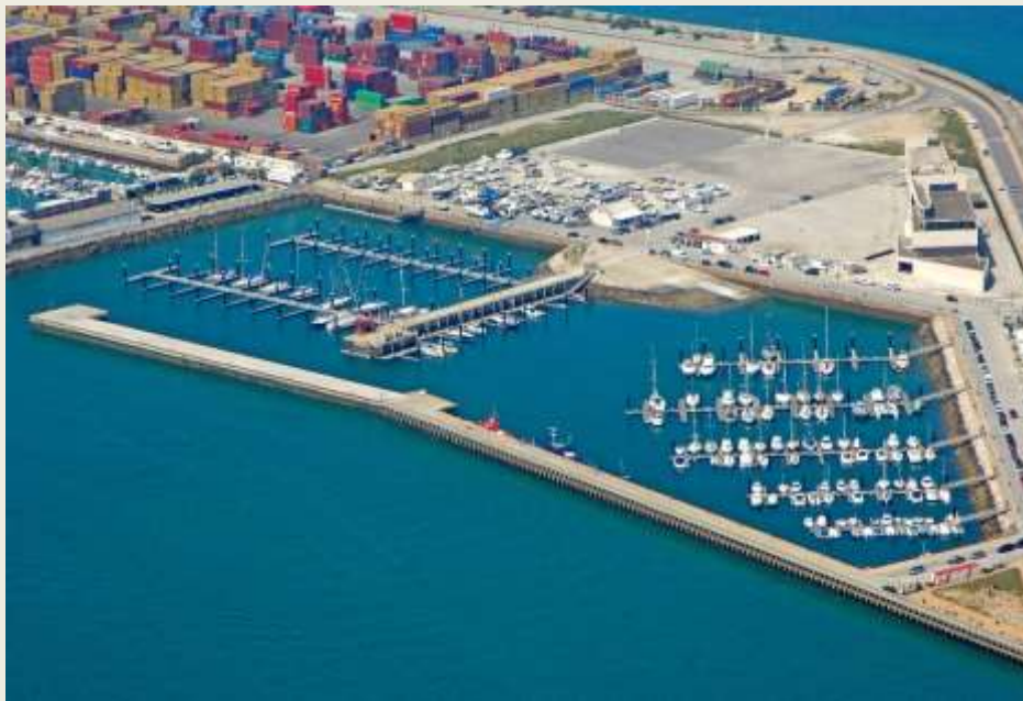
Travesía con viento favorable durante todo el trayecto

Rumbo a aguas de Cádiz a Puerto América donde después de un merecido descanso recalaremos en el REAL CLUB NAUTICO DE CADIZ decano de de España fundado en el año 1868, donde tendrá lugar la conferencia “ANDRES DE URDANETA Y EL TORNAVIAJE”