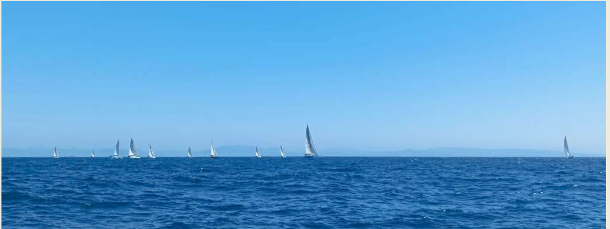
Viento favorable del Oeste en el cruce del estrecho de Gibraltar

Salto de continente navegamos rumbo a TANGER en la costa Norte de Marruecos ciudad cosmopolita y hospitalaria. Navegamos dando resguardo a las orcas siempre en sonda de 20 más hasta llegar a Torre Gracia donde dimos el salto.