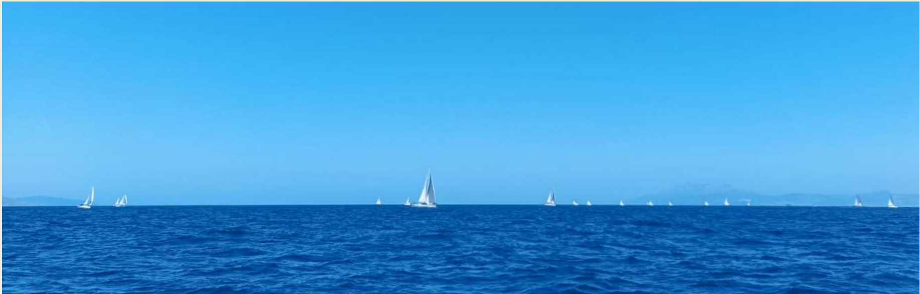
Por proa África